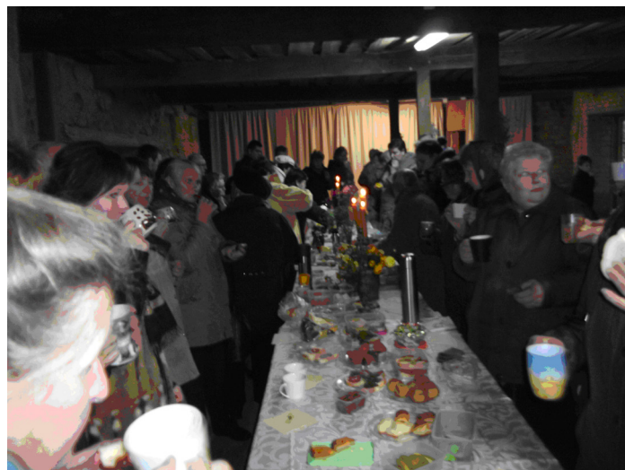
Piligrimai iš Ignalinos. Agapė.