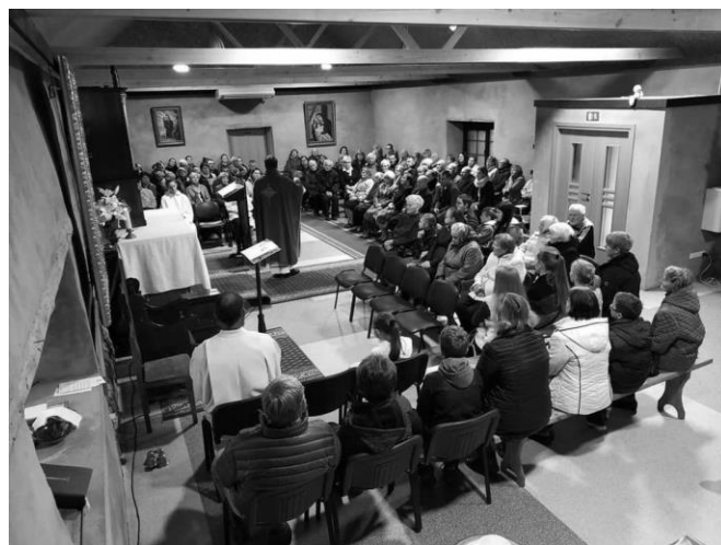
Bazilikos remonto darbai ir malda parapijos namuose.