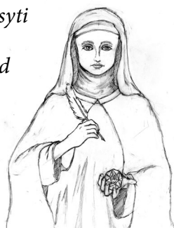
Šv. Teresė Avilietė (1515–1582 m.)

Išmokyk pastebėti žmonėse gerumą ir suteik man dovaną apie tai papasakoti kitiems.